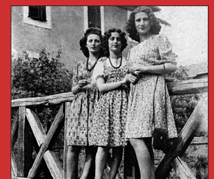
Quel ponticello di legno su via delle Sette Chiese pag 4