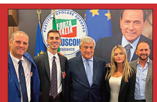
Cambi di casacca nell'aula di via Benedetto Croce pag 2

Per maggiori informazioni sulla programmazione è possibile visitare il sito teatropalladium.uniroma3.it