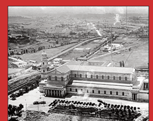
Rievocato il bicentenario dell'incendio della Basilica di San Paolo pag 5