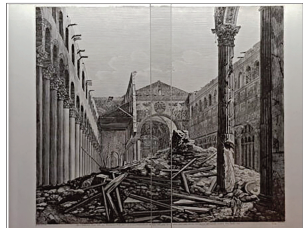
Incisione di Luigi Rossini raffigurante una veduta della basilica distrutta

religiosa. Nel luglio scorso è stata proprio l'Università Roma Tre a rievocare il bicentenario del catastrofico rogo con una conferenza "San Paolo infiamma" nel giardino del Parco Schuster, a poche decine di metri dall'imponente chiesa.