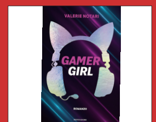
"Gamer Girl", il secondo romanzo di Valerie Notari pag 6