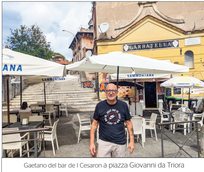
Gaetano del bar de I Cesaroni a piazza Giovanni da Triora

Con sei stagioni e otto milioni di spettatori “I Cesaroni” è stata una delle fiction più seguite degli ultimi anni, un vero e proprio fenomeno di costume. Andata in onda su Canale 5 dal 2006 al 2014 ha raccontato con toni vivaci e ironici la storia di due ex fidanzati che si ritrovano dopo vent’anni: Claudio Amendola ossia Giulio Cesaroni, nei panni di un oste e padre vedovo di tre figli maschi e Lucia Liguori, una professoressa divorziata con due figlie, interpretata da Elena Sofia Ricci. Giulio e Lucia capiscono di amarsi ancora e decidono di sposarsi e vivere insieme con la prole avuta dai precedenti matrimoni. L’idea di ricominciare nasce proprio dall’enorme popolarità del format, liberamente ispirato alla serie spagnola