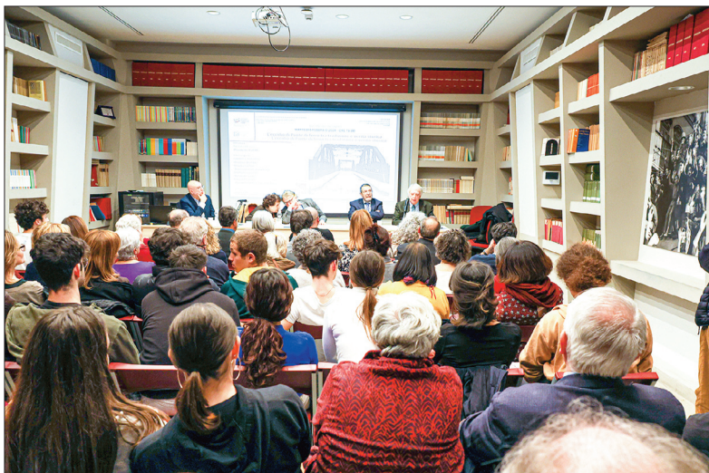
L'evento organizzato alla Casa della Memoria

lane, uccise il 7 aprile 1944 da parte di militi nazisti sul Ponte dell'Industria, noto ai romani come Ponte di Ferro.