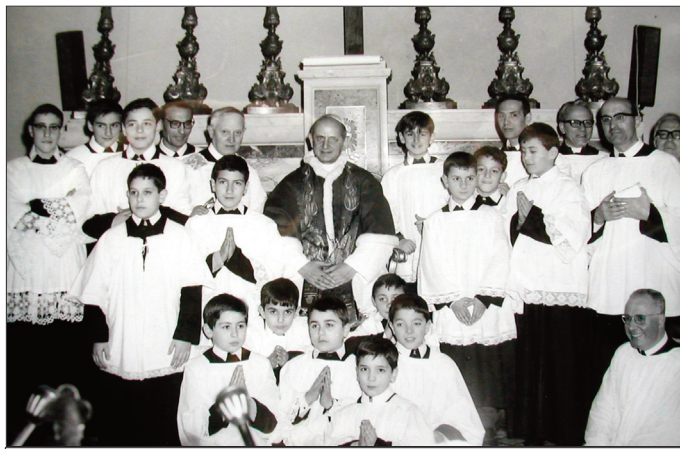
19 febbraio 1967 Paolo VI in visita alla chiesa San Filippo Neri

A partire da quella data, negli ultimi 72 anni, la parrocchia è stata centro di formazione e di spiritualità, di attività