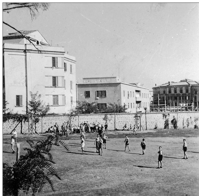
Oratorio San Filippo Neri ottobre 1940