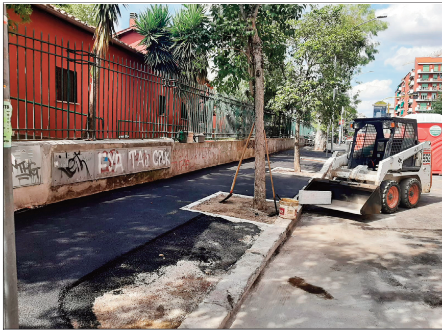
Rifacimento marciapiedi in via Giacinto Pullino

Altrettanto avviene davanti all'ufficio postale, dove c'è un parcheggio di ciclomotori e dove l'inciviltà porta a lasciare i veicoli in seconda fila bloccando l'uscita delle due ruote. Altri abitanti della zona hanno richiamato l'attenzione per ciò che avviene nei fine settimana (soprattutto nelle ore serali di venerdì e sabato) proprio in via Matteucci all'intersezione semaforica con la via Ostiense, dove in barba al codice della strada, le auto vengono lasciate in divieto sosta dagli avventori notturni dei locali della zona. La stessa cosa avviene in prossimità o a ridosso dei molti locali sorti negli ultimi vent'anni alla Garbatella. Lasciare l'auto in doppia fila, come parcheggiare sui marciapiedi, è purtroppo un mal costume diffuso. In via Chiabrera a San Paolo o lungo via Ambrosini alla Montagnola, soltanto per fare un esempio, è un'abitudine consolidata. Altrettanto avviene presso molti edifici scolastici del Municipio prima e dopo il suono della campanella, quando i genitori accompagnano i figli a scuola.