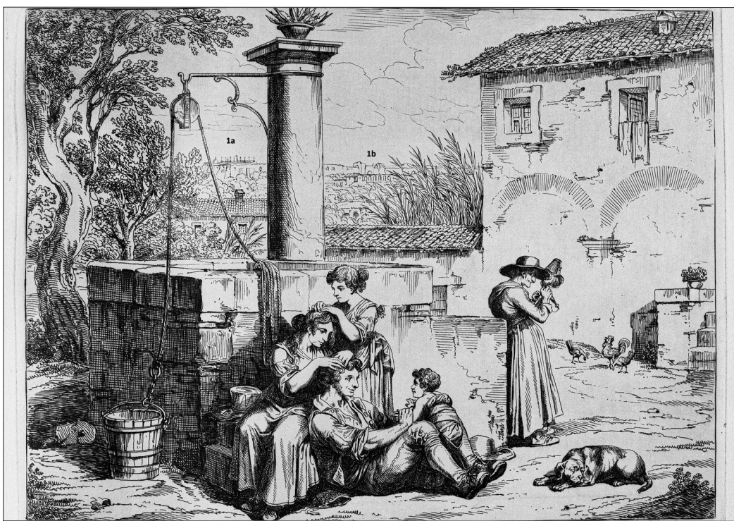
Ritratto di famiglia campestre fuori porta San Paolo. Incisione del pittore romano Bartolomeo Pinelli