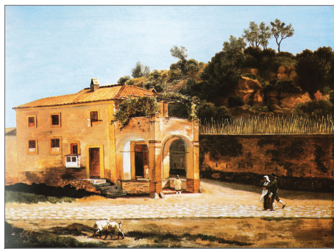
Una osteria sotto la rupe di San Paolo. C.W. Eckersberg 1815

vertà. E ci fa pensare inoltre, con un po' di fantasia, a quello che potrebbe essere un quadro familiare che ritrae la famiglia di Clementina Eusebi, la donna da cui nasce il toponimo Garbatella. Grazie a documenti reperiti presso l'archivio del Monastero San Paolo, conosciamo la composizione di quella famiglia poco prima della data del 1830. Ci piace immaginare che Ca-