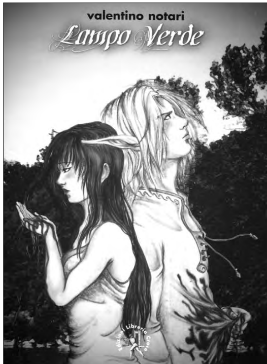
tasy. Abbiamo rivolto all'autore qualche domanda per anticipare a "Cara Garbatella" il senso di questa sua prima impresa letteraria. D. Vuoi

spiegare ai lettori comuni che cos'è la letteratura fantasy e quali sono i suoi autori di riferimento? R. La letteratura fantasy è un genere che in Italia sta avendo un discreto successo solo da pochi anni, ma affonda le sue radici nel passato e nel folklore delle popolazioni del nord Europa e di origini celtiche. Magia e leggenda la fanno da padrone, spesso condite da una punta di epica e, in molti casi, perfino di poesia. Il padre del fantasy è senza alcun dubbio Tolkien, che negli anni '50 riversò su carta un capolavoro conosciuto come "Il Signore degli Anelli". Recentemente non si può non citare JK Rowling, madre del mago occhialuto Harry Potter, ma la saga che più di ogni altra è stata capace di catturare la mia ammirazione è quella dell'americano Philip Pullman: "Queste Oscure Materie", conosciuto come "Il Signore degli Anelli". E ovviamente molto importante anche per la mia esperienza è il successo tutto italiano delle "Cronache del Mondo Emerso" di Licia Troisi, di cui sono uno sfegatato fan! D. Puoi raccontare in breve il contenuto delle 475 pagine del tuo libro? R. Quando nella mia testa la storia di "Lampo Verde" ha cominciato a delinearsi, avevo chiarissimo un obiettivo: volevo raccontare una storia d'amore. Nel mio libro, in cui due mondi profondamente diversi fra loro si trovano a collimare in una sola dimensione con conseguenze catastrofiche per le