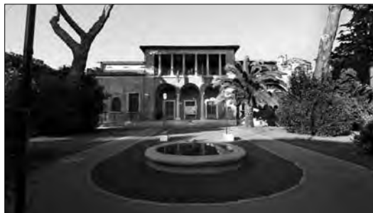
La "scoletta" di Piazza Longobardi. La parte centrale dell'edificio corrisponde al cinquecentesco casino di caccia di Filippo Sergardi. Le due ali laterali furono aggiunte nel 1927 dall'architetto Sabbatini per adattare l'edificio ad asilo

bella architettura del nucleo centrale della "scoletta", con i tre archi di base e la loggia al primo piano, appartenne all'ex casino di caccia o villa di campagna di un nobile senese che nei primi anni del 1500 si era trasferito a Roma presso la corte papale, appunto