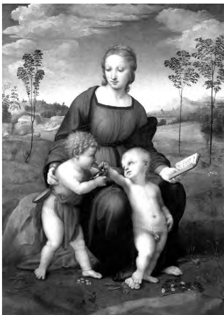
Raffaello Sanzio, "Madonna col Bambino e San Giovannino" ovvero "La bella giardiniera", 1507 o 1508, olio su tavola, Museo del Louvre, Parigi

Il nobile toscano che, nel '500, si fece costruire la bella villa di campagna, nucleo centrale dell'attuale "scoletta" della Garbatella, fu anche il committente o l'acquirente del celebre dipinto di Raffaello "La bella giardiniera". Si chiamava Filippo Sergardi. Non credo che i lettori si ricordino di questo nome. Ne