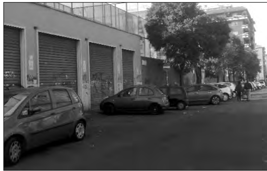
Il muro di via della Moletta che dovrebbe essere abbattuto per dare spazio alla nuova Piazza del Campidoglio Due