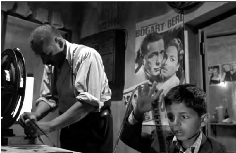
Sopra, un'immagine eloquente tratta dal film "Nuovo cinema paradiso" che ci riporta allo stesso clima che si viveva dentro "Er Pidocchietto". A destra, l'interno del Columbus poco prima di trasformarsi in un'aula universitaria.

Padre Guido provò pure a mettere in programmazione qualche pellicola con velleità "culturali". Niente di particolarmente impegnato, qualche